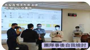
團隊事後自我檢討